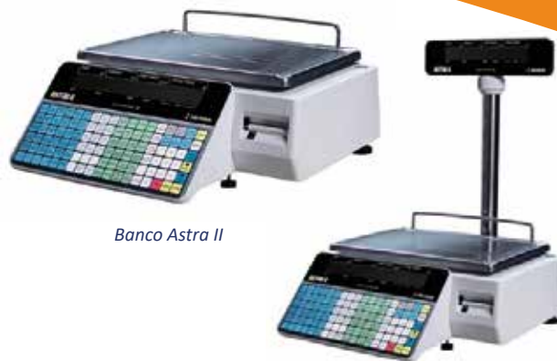
Banco Astra II