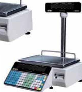
Polo Astra II